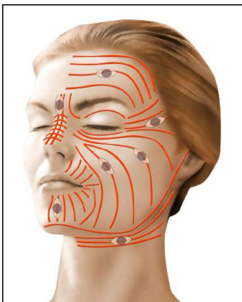
lignes de moindre tension de la face - orientation optimale des fuseaux d'excision

Souvent, il est nécessaire d'avoir recours à un tracé d'incision spécial visant à « briser » l'axe principal de la cicatrice initiale, à réorienter au mieux la cicatrice en fonction des lignes de tension naturelles de la peau, et à diminuer ainsi la tension exercée sur les berges de la plaie.