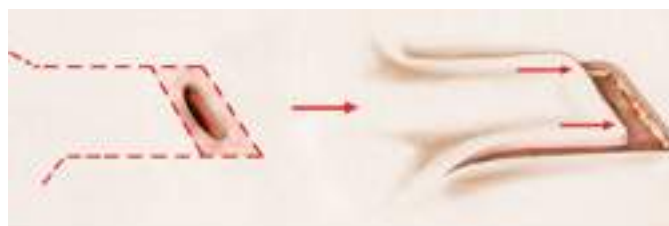
exemple de plastie locale : avancement d'un lambeau cutané

Dans les cas où la taille de la lésion ou sa localisation rendent irréalisable une fermeture par suture directe, la couverture de la zone retirée sera assurée soit par une greffe de peau prélevée sur une autre région, soit par une plastie locale qui correspond au déplacement d'un lambeau de peau avoisinant afin que celui-ci vienne recouvrir la perte de substance cutanée (cf schéma ci-après). La rançon cicatricielle de ce type de lambeau est bien sûr plus importante, mais, réalisé dans les règles de l'art, les résultats esthétiques à terme sont toutefois souvent meilleurs que ceux d'une greffe.